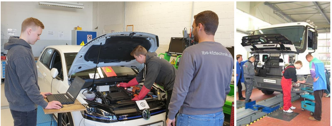
Diagnose an einem HV-Fahrzeug und einem Nutzfahrzeug

Die Auszubildenden sind aufgrund dieser Lernortkooperation bis zu acht Wochen länger im Betrieb.