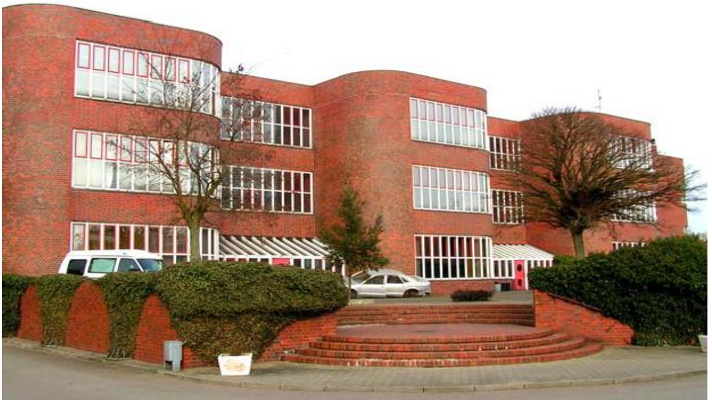
Blick auf das Gebäude mit den Unterrichtsräumen, Laboren und die überbetrieblichen Werkstätten auf dem Priwall

Die Beschulung der Auszubildenden erfolgt jahrgangsweise in Fachklassen.