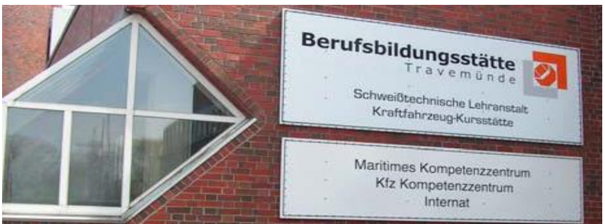
NFZ-/SP-Hallen / Unsere Ausbildungspartner

Unsere Schule verfügt neben Klassenräumen über modern ausgestattete Kfz-Elektrik- und Technik-Labore. Darüber hinaus stehen uns im Rahmen der Lernortkooperation die Kfz- Werkstätten und Medien der Berufsbildungsstätte auf dem Priwall zur Verfügung, z. B. Elektro-, Hybrid- und Brennstoffzellen-betriebene Fahrzeuge. Neben diesem besonderen Standortvorteil bietet das Kfz-Kompetenzzentrum Schleswig-Holstein für Diagnose, Mess-, Steuer- und Regeltechnik der Handwerkskammer Lübeck auf dem Priwall hervorragende Synergieeffekte für eine qualitativ hochwertige Aus- und Weiterbildung in der System- und Hochvolttechnik.