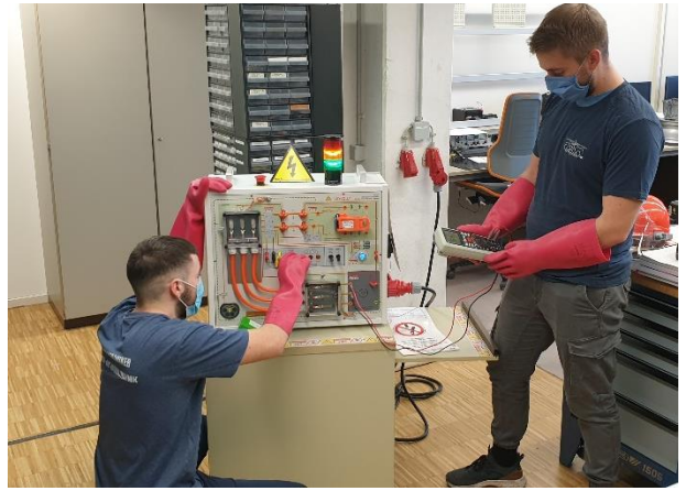
Arbeiten an hochmodernen Ständen für E-Mobilität im Messlabor