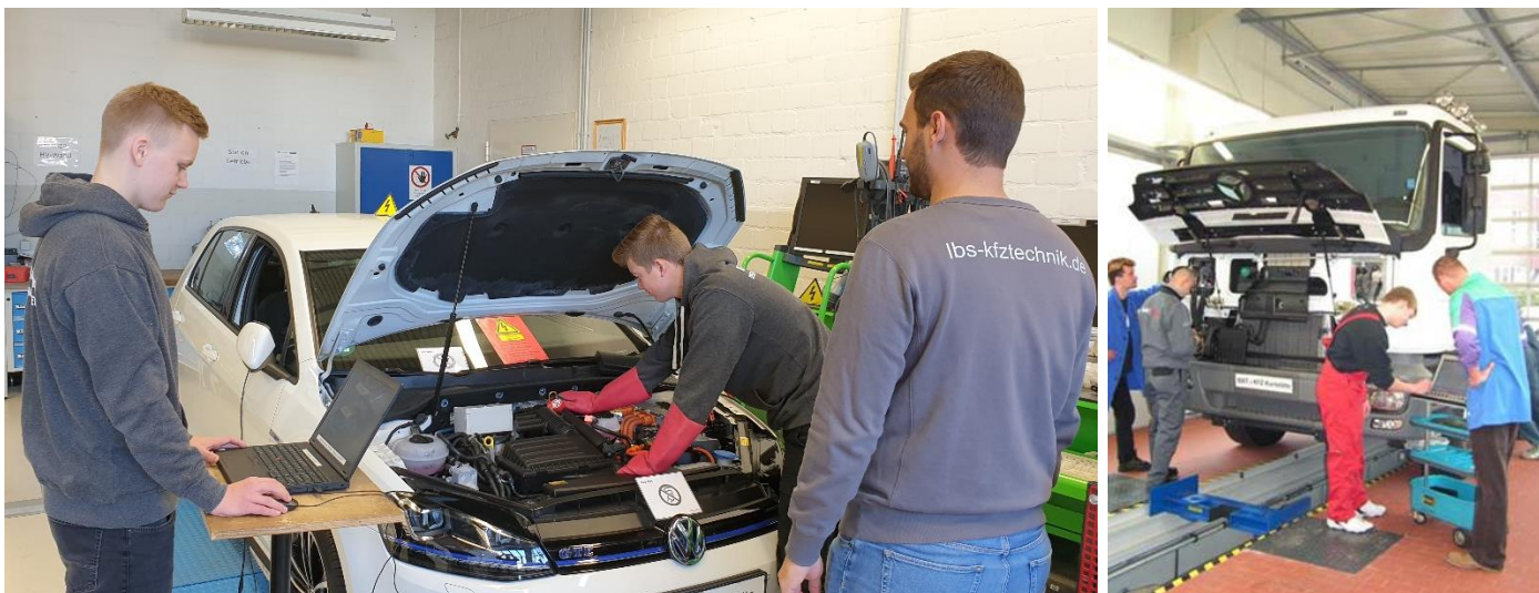
Diagnose an einem HV-Fahrzeug und einem Nutzfahrzeug

Die Auszubildenden sind aufgrund dieser Lernortkooperation bis zu acht Wochen länger im Betrieb.